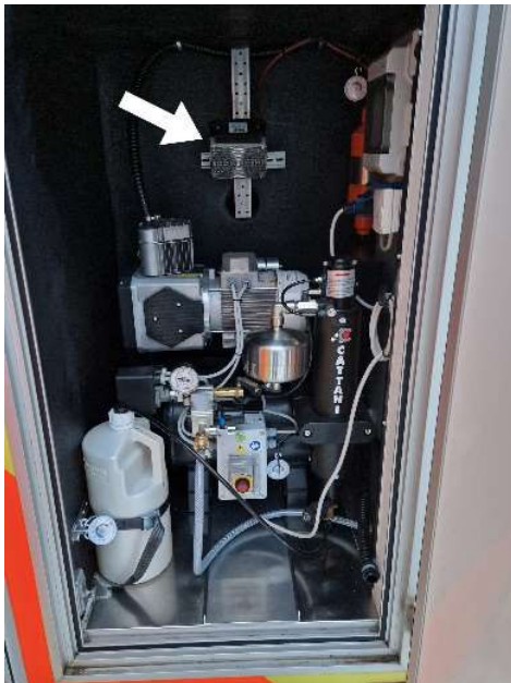
Kompressor mit Gebläseheizung