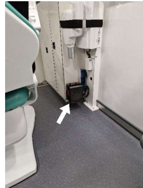
Heizlüfter in der Kabine